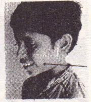
विटामिन की कमी से होने वाला दाग