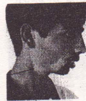
जन्म का दाग

कुष्ठ रोगाणु की खोज करने वाले नॉर्वे के डॉ. हेनसन्स ने कुष्ठ प्रभावित व्यक्ति के शरीर पर उभरी गांठों का रस इंजेक्शन द्वारा अपने शरीर में तीन बार प्रविष्ट कराया था। लेकिन उनके शरीर की पर्याप्त रोग प्रतिरोधक क्षमता के कारण उन्हें यह रोग नहीं हुआ। हालांकि कुष्ठ एक संक्रामक रोग है किन्तु वास्तव में बहुत कम रोगी संक्रामक होते हैं। कुष्ठ पीढ़ी