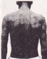
चमड़ी पर सूजन, दाने गठानें

कुष्ठ पीढ़ी दर पीढ़ी नहीं होता, यह जन्मजात रोग नहीं है, यह किसी विशेष खानपान से नहीं होता, पाप-श्राप या देवी-देवताओं के रूठने से इसका कोई सम्बंध नहीं है, यह छुआछूत से भी नहीं होता। कम रोग प्रतिरोधक क्षमता होने से यह रोग एक-आधे प्रतिशत व्यक्तियों को हो सकता है। इसमें भी 85 प्रतिशत व्यक्ति ऐसे होते हैं जिनके शरीर में कुष्ठ के रोगाणुओं की संख्या बहुत कम होती है और ये रोगाणु उनके शरीर से बाहर नहीं निकलते।