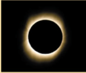
एक अनदेखा सूर्य ग्रहण