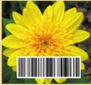
पीधों का बारकोड