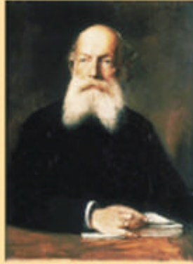
स्वप्नदृष्टा रसायनज्ञ केकुले